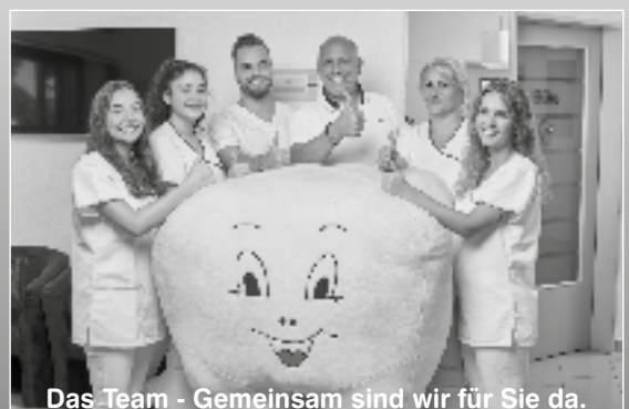
Das Team - Gemeinsam sind wir für Sie da.

Keine Sanierung ohne unser kostenloses Gegenangebot!