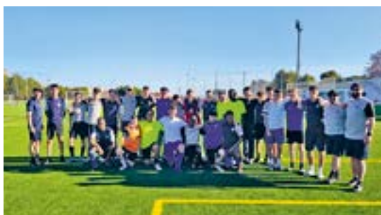
Die Junioren beim Training in Benidorm