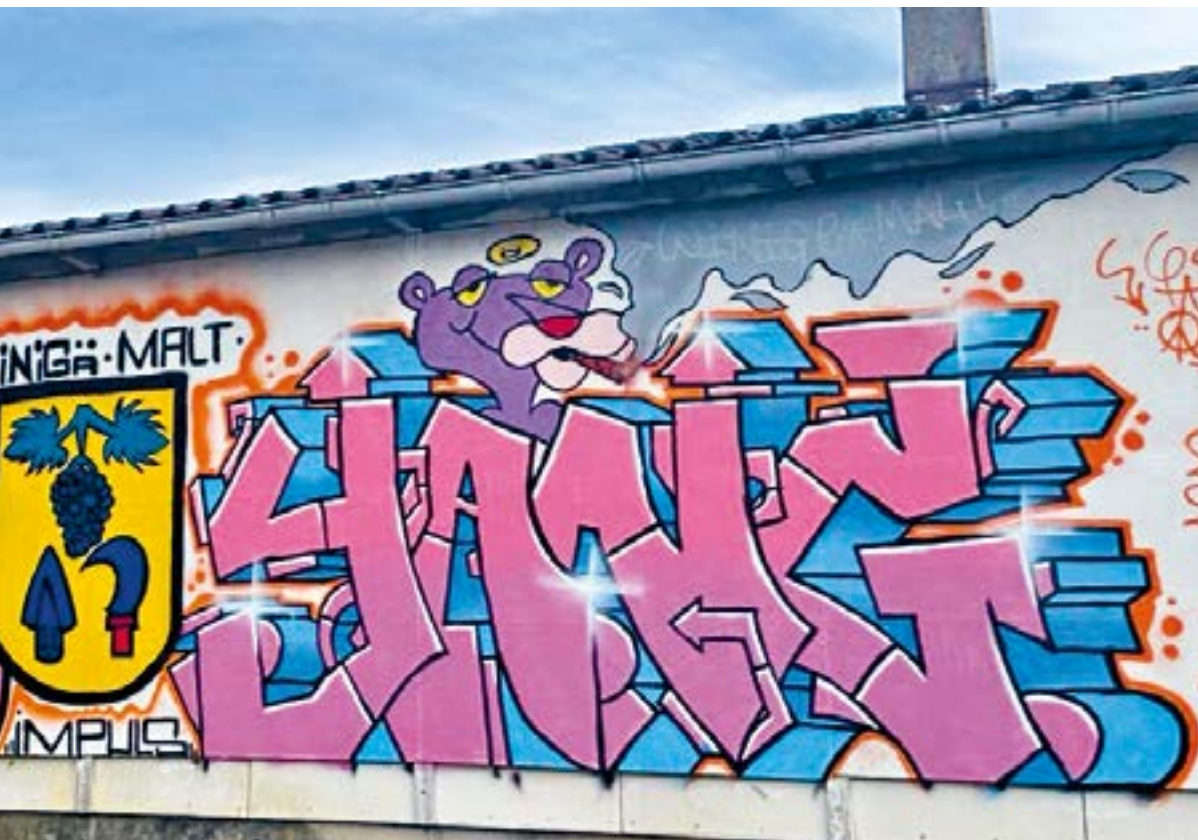
Sprayerwand beim Jugendraum

Die Zusammenarbeit mit MOJUGA ermöglicht auch eine engere Vernetzung mit den benachbarten Gemeinden Geroldswil und Oetwil a.d.L. Gemeinsame Veranstaltungen sollen so besser koordiniert werden, um allen Altersgruppen ein vielfältiges Angebot zu bieten.