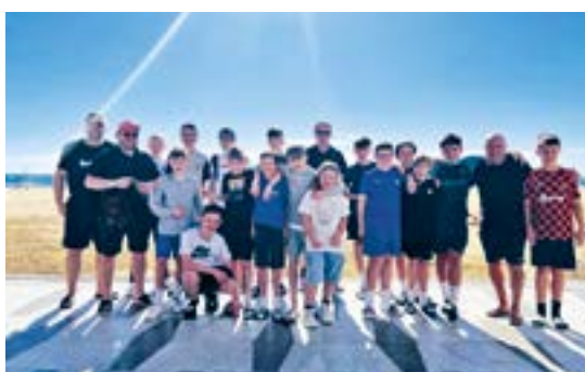
Perfekte Bedingungen im sonnigen Benidorm