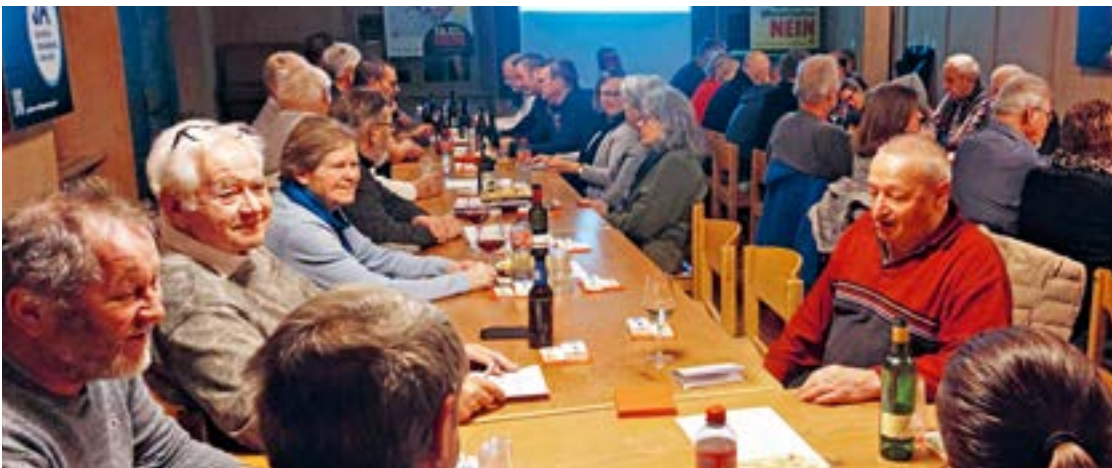
SVP Stamm vom 16.1.2024