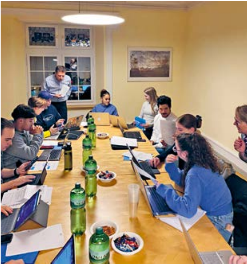
Steuerabend im Schlössli